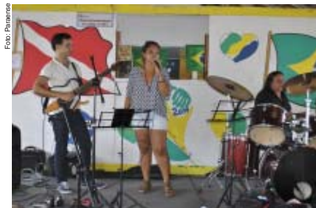
Professora dando show em homenagem à categoria