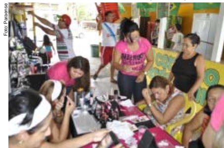
Maquiagem e limpeza de pele para a categoria