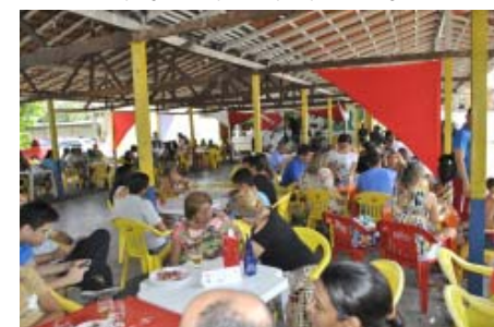
Professores aproveitando o seu dia