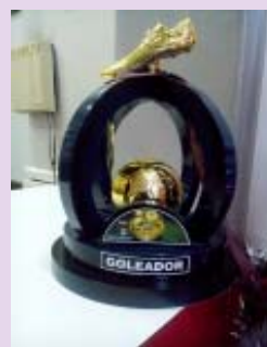
Troféus de Artilheiro e Golfeiro menos vazado da Copa SINPRO/PA de Futsal deste ano.

Prestigie este momento de integração e valorização dos professores da rede particular de ensino.