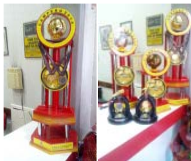
Troféus e medalhas deste ano