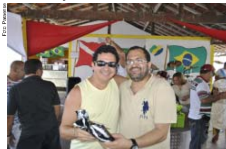
Professor recebe premiação