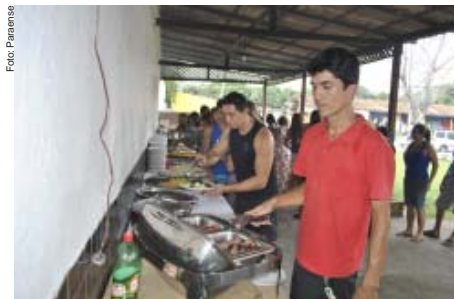
Lauto almoço foi oferecido à categoria