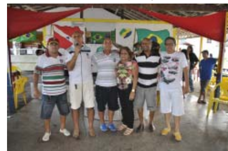
Parte da diretoria: todos unidos em prol da categoria