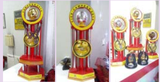
Troféus e medalhas da Copa SINPRO/PA de Futsal deste ano

Para comemorar esses 20 anos criamos um selo comemorativo, dando maior seriedade ao evento, como parte obrigató-