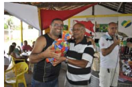
Entrega de premiação