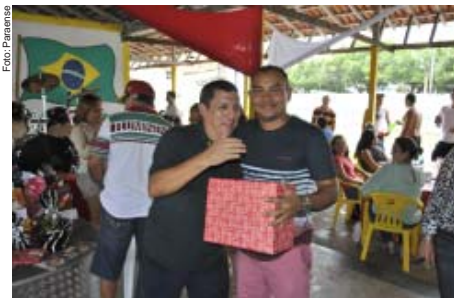
Entrega de prêmio ao professor sorteado