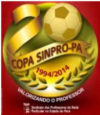
Selo comemorativo dos 20 anos de futsal do Sinpro/Pará

Este ano a Copa de Futsal do SINPRO/PA alcança a marca de 20 anos, sendo um dos torneios sindicais mais antigos em atividade no Pará.