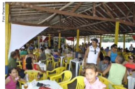
Professores em momento de lazer