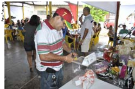
Corte do laque da urna de premiação